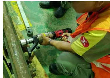
RMW-26用于地铁轨道螺栓拆装