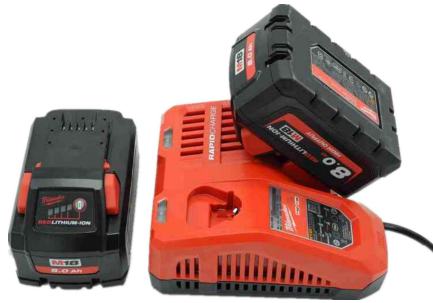
标配8安时电池2块，快充1个